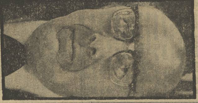
HABLAN SOBRE OVNIS