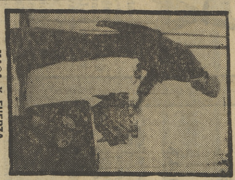
MARA Y FUERZA