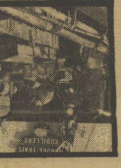
TONY RANDALL, EN LA SERIE

10,35 LAS TRIBULACIONES DEL JUEZ FRANKLIN