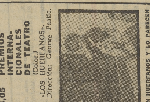
SON HUERTANOS Y LO PARECEN

4,05 PREMIOS NACIONALES DE TEATRO (Color.) «LOS HUERTANOS.» Dirección: George Pastic.