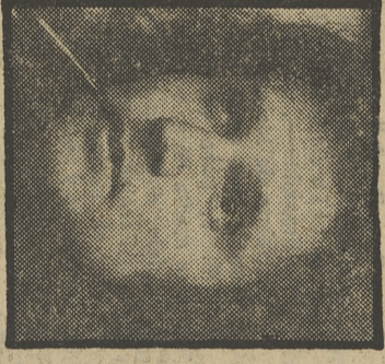
ROBERTO CARLOS ACTUA HOY

(Color.) Programa informativo. 300 MILLONES