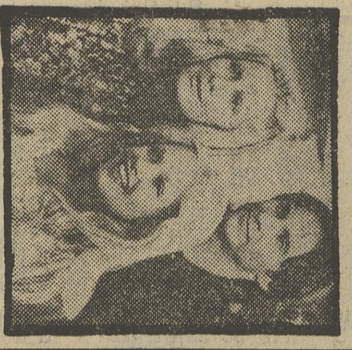
UN TRIO EN LA SERIE

Dirección: Irving Moore. Guión: David Jacobs. Intérpretes: Barbara Hel Geddes, Jim Davis, Patrick Duffy, Victoria Principal, Charlene Tilton, Da-