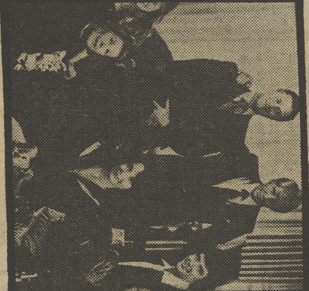
LOS PERSONAJES DE «DALLAS»

«LA HIJA DE DIGGER». Dirección: Robert Day. Guión: David Jacobs. Interpretes: Barbara Bel Geddes, Jim Davis, Patrick Duffy, Victoria Principal, Charlene Tilton y Linda Gray.