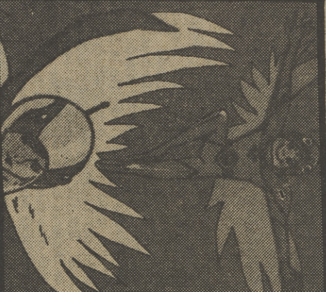
«LA BATALLA DE LOS PLANETAS»

4,05 LA BATALLA DE LOS PLANETAS (Color.) «VACACIONES EN VENUS»