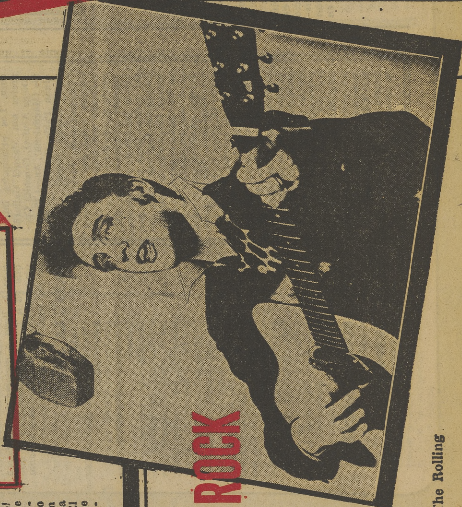
"HEROES DEL ROCK AND ROLL"