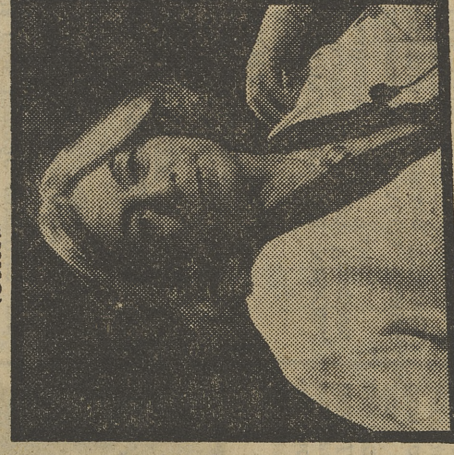
CARMEN MARTIN GAITE

CARMEN MARTIN GAITE. Dirección y presentación: Joaquín Soler Serrano. Realización: Ricardo Arias. Programa de TVE en el que mediante entrevistas a fondo se analizan diversas personalidades relacionadas con las artes, las ciencias y las letras.