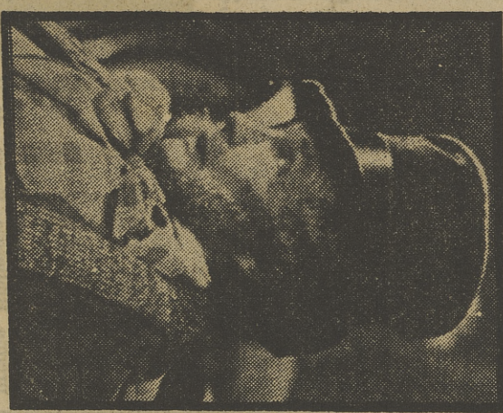
«DICKENS DE LONDRES»

● Incluso durante las vocaciones, Charles Dickens está inmerso en su trabajo y su esposa, Kate, se siente deprimida y sola. Le afecta, sobre todo, el hecho de que cada vez que intenta coger en brazos a su hijo, el niño empieza a llorar. Con la familia Dickens vive también la hermana de Kate, Mary, con quien Charles pasa cada vez más tiempo, y a Charles le parece que ella es la única persona que parece comprenderle. En esta época, Charles tiene el propósito de escribir una obra junto con el compositor John Hulih para el teatro St. James, de Londres. Pero la tragedia de una muerte va a dejar huellas imborrables en el espíritu del escritor.