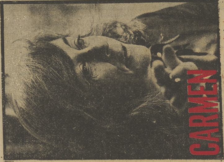
CARMEN MARTIN GAITE

SE RA un deleite ver y oír a Carmen Martín Gaité el próximo lunes, en "A fondo", el programa de Joaquín Soler Serrano, porque Carmen es una de nuestras escritoras más lúcidas. Carmen también tiene un sentido lúdico de la existencia, lo que le ha hecho afirmar sin ambages que para ella la literatura, por encima de todo, es un placer. Desde que publicó "El balneario" y "Entre visillos", en la década de los cincuenta, todo el mundo supo de la envergadura de este personaje.