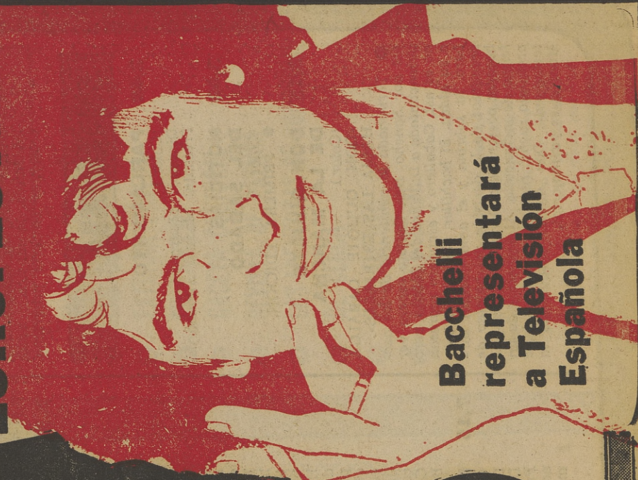
Bacchelli representará a Televisión Española