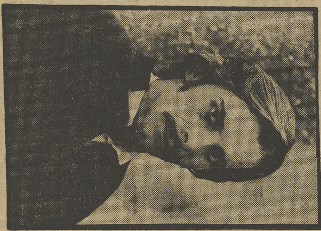
«EL CONDE DE MONTECRISTO»

● Montecristo eléctrica implacablemente el plan que se ha trazado para castigar a aquellos que causaron su desgracia. Caderousse se ha evadido de prestido con un cómplice e intenta saltar la mansión del conde en los Campos Eliseos, pero es asesinado por otro forzado, Benedetto. Ahora le toca el turno a Fernand, quien también es excluido de la Cámara de los Pares por su colaboración con los turcos cuando servía en Grecia. Fernando reconoce finalmente la verdadera identidad de Montecristo.