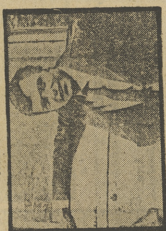
«DOCTOR EN CASA»

● El profesor Loftus supervisa la primera experiencia de Michael en un quirófano. No pasa mucho tiempo sin que el joven tenga que retirarse al no poder soportar la vista de la sangre.