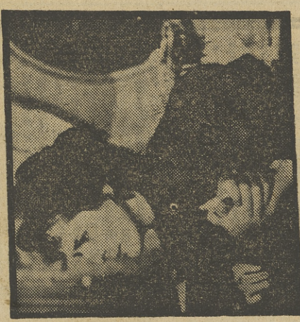
GIULIANA DE SIO