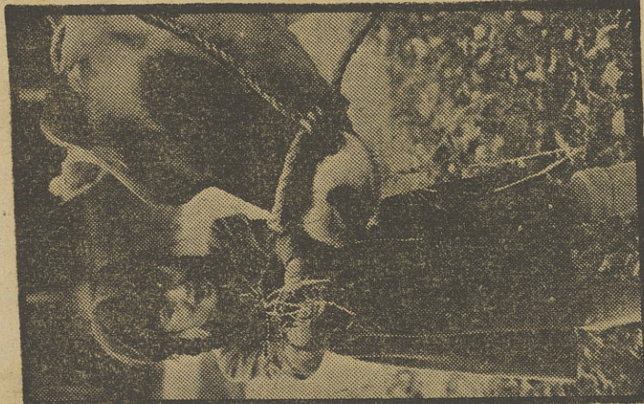
«LOS WALTON» Interpretes: Richard Thomas, Ralph Waite, Will Geer, Ellen Corby y Jack Garner.