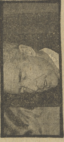
JEAN-J. SERVAN SCHREIBER