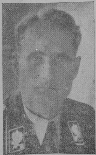
Rodolfo Hess, Representante de Hitler en el Partido Nazi