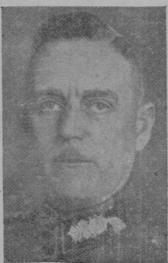
El General Keitel, Jefe de Estado Mayor alemán