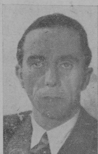
José Goebbels, Ministro de Propaganda del III Reich

de estas palabras del gobernador, el coche real siguió su camino.