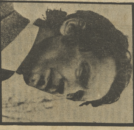
● «GRANDES RELATOS»

● El director del banco da a Davinia solamente veinticuatro horas para decir si vende su casa o las acciones en la Organización Woyti. De nuevo es Tom Pearson quien permanece a su lado, aconsejándole que aparente vender su casa, poniéndola en manos de un agente de ventas; es una forma de ganar tiempo, mientras él utiliza sus contactos personales para conseguir dinero. Sir Clive Farrer y Ronnie Bartlett no creen que Tom esté actuando desinteresadamente. Están convencidos de que está dando a Davinia suficiente cuerda para que ella misma pueda ahorcarse.