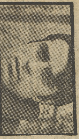
JESUS HERMITA ATENCIÓN, POR FAVOR (Color.)