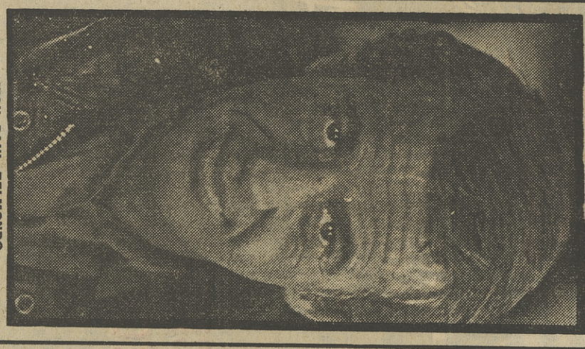
JEAN PAUL BELMONDO

«COMO DESTRUIR AL MAS FAMOSO AGENTE SECRETO DEL MUNDO?» (1974). Dirección: Philippe Brocca. Interpretes: Jean Paul Belmondo, Jacqueline Bisset y Vittorio Capriolo.