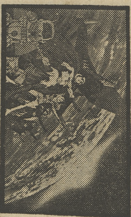
«LA BATALLA DE LOS PLANETAS»