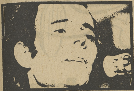
Julio Iglesias es, en estos momentos, el único español que triunfa en Europa.

L AS cosas han cambiado poco respecto a la semana anterior. Menos mal, porque de otro modo esto sería un mareo. Conviene, de todas formas, pegar otro repaso al mundo del disco en el mundo discográfico.