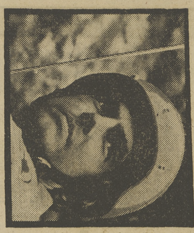
«240 - ROBERT»

● Un aeroplano se estrella en la playa del sur de California. Rápidamente es avisada la patrulla de rescate 240-Robert, que comienza la búsqueda de supervi-vientes. Durante la investigación llevada a cabo bajo el agua, los buceadores son sorprendidos por dos intrusos armados de cuchillos. Pronto se descubre que la carga que contenía el avión era cocuina por valor de un millón de dólares.