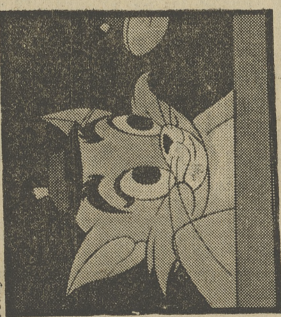
«TOM Y JERRY»

● «ESA ES MI MAMI». Tom es su madre. Este se aprovecha de la circunstancia para prepararse un exquisito pato a la naranja. ● Tom es el cazador de ratones más famoso del Oeste y es contratado por el comisario del pueblo para que atrape a Jerry.