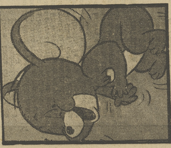
TOM Y JERRY

6,55 TOM Y JERRY (Color.) EL PATO APESADUMBRADO.