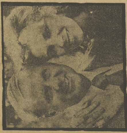
«CON OCHO BASTA»

Interpretes: Dick van Patten y Betty Buckley. ● Los hijos de Bradford han comenzado a revelarse contra las restricciones impuestas por su padre. Este se da cuenta de que, efectivamente, los está tratando como niños y no como adultos que ya son. Preocupado por la situación, Tom adopta una nueva filosofía, presentando una imagen totalmente diferente.