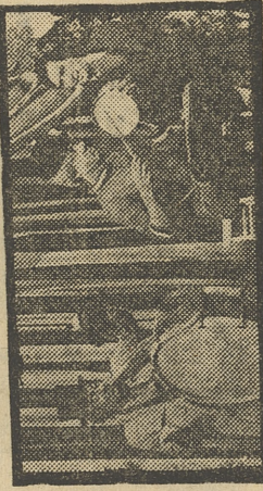
«EL CIRCO DE TVE»

DIBUJOS ANIMADOS: «Hong Kong Fuy». EL CIRCO DE TVE. Autor e intérpretes: Mikki, Fofito y Mikikito. Realización: Juan Villalobos. Los conocidos payasos de la «tele», con nuevas anécdotas, chistes y mu-