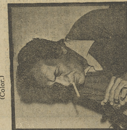
7,00 CINE ESPAÑOL (Color.)

● Kaz Vin es una ciudad de ladrones. Sobre todo hay tres que traen a todo el mundo de cabeza. Un día llega a la ciudad un campesino, al que primero le roban la cabra y después el burro y, finalmente, la ropa. Le han engañado diciéndole que en un pozo hay un tesoro. Poco después los ladrones despojan a un matrimonio que tras una disputa han decidido no hablarse. Poco después, matrimonio y campesino van a ver al cadí.