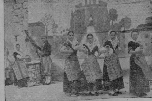
LA AGRUPACION FOLKORICA «AIRES DE MONTANA» EN UNA BELLA ACTUACION