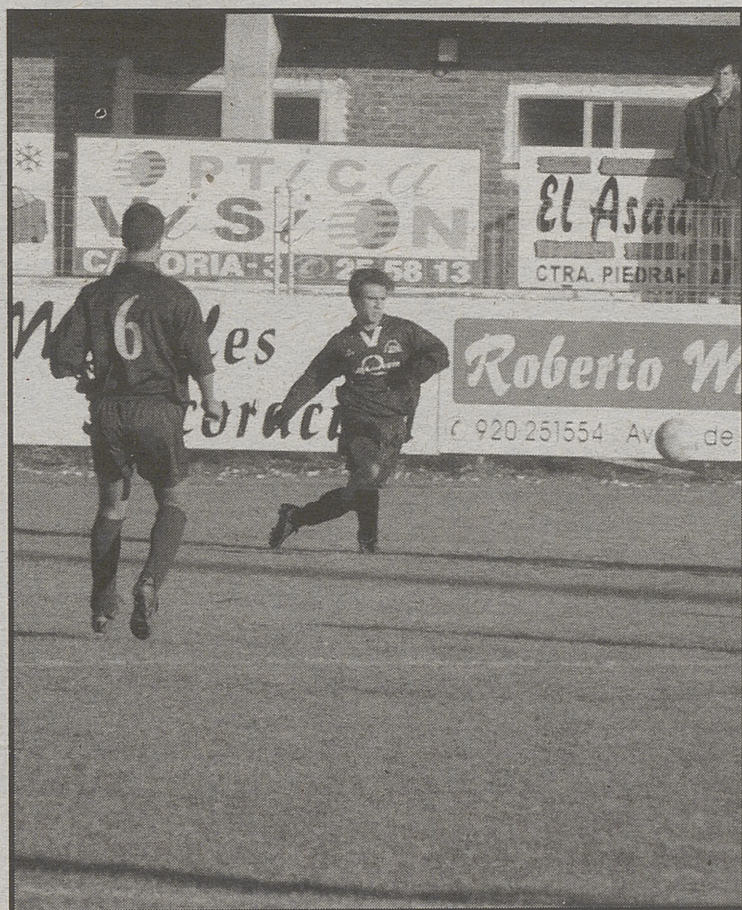
Jugadores del equipo de la Zona Norte.

El Bosco de Arévalo se impuso por 2-0 al Zona Norte, en el derbi provincial disputado en la tarde del pasado sábado. No obstante, el equipo arevalense tuvo que esperar a los minutos finales para doblegar la resistencia del equipo capitalino, que vendió muy cara su derrota.