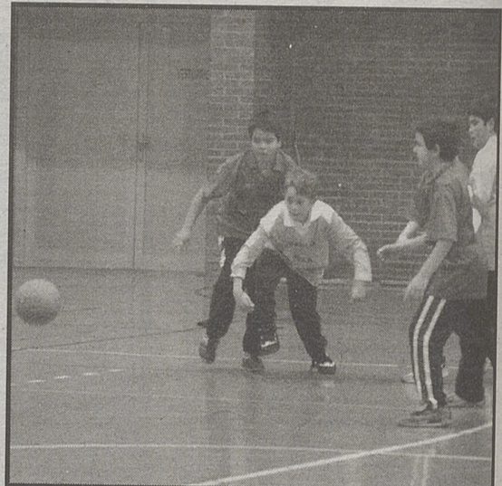
Jugadas de partidos de los Escolares del pasado sábado.