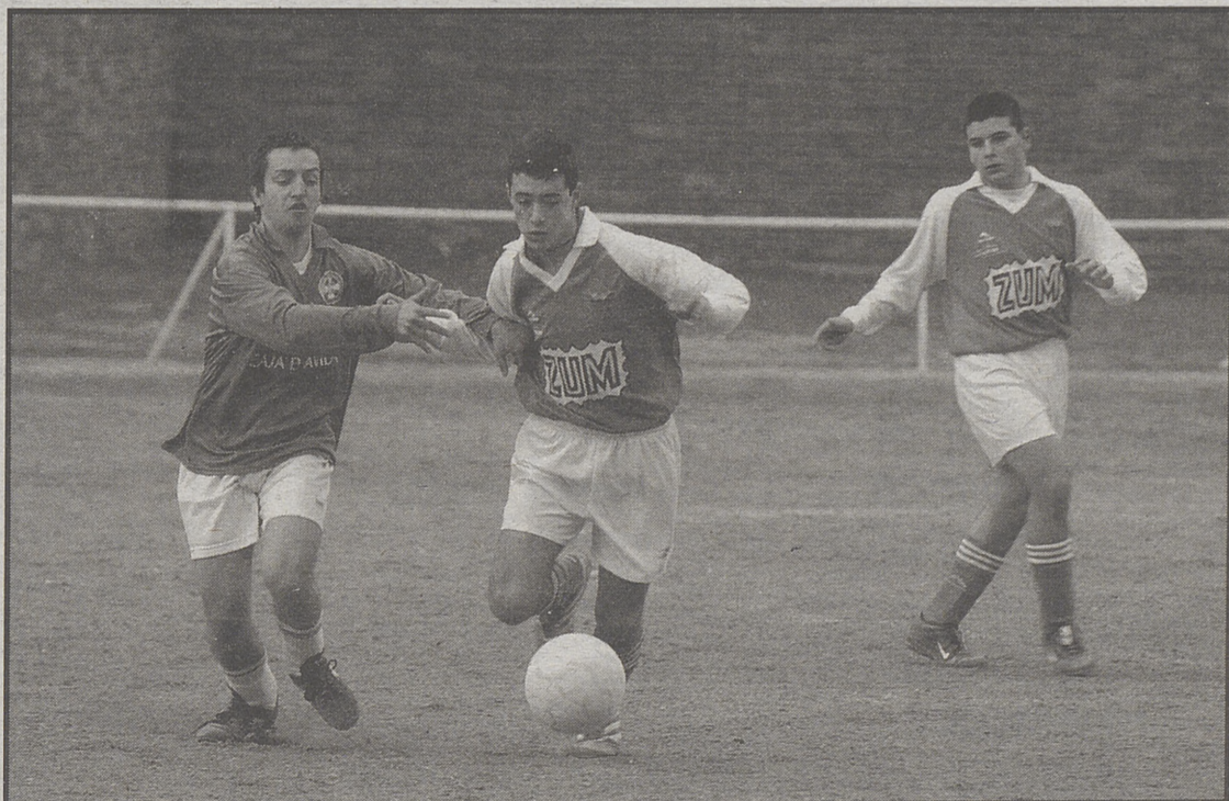
Lance del encuentro entre la Casa Social y Las Navas.