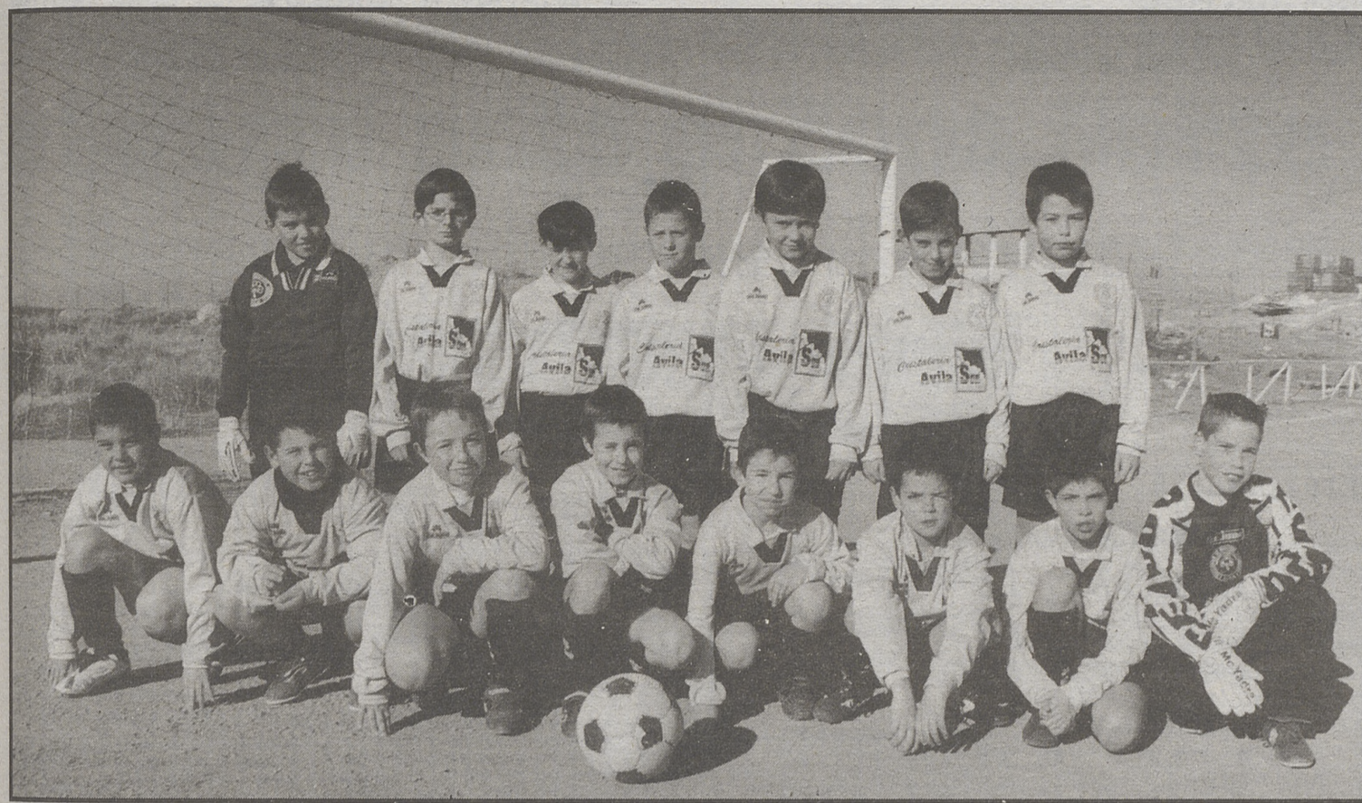
Componentes del equipo A de la categoría benjamín de la Zona Norte.