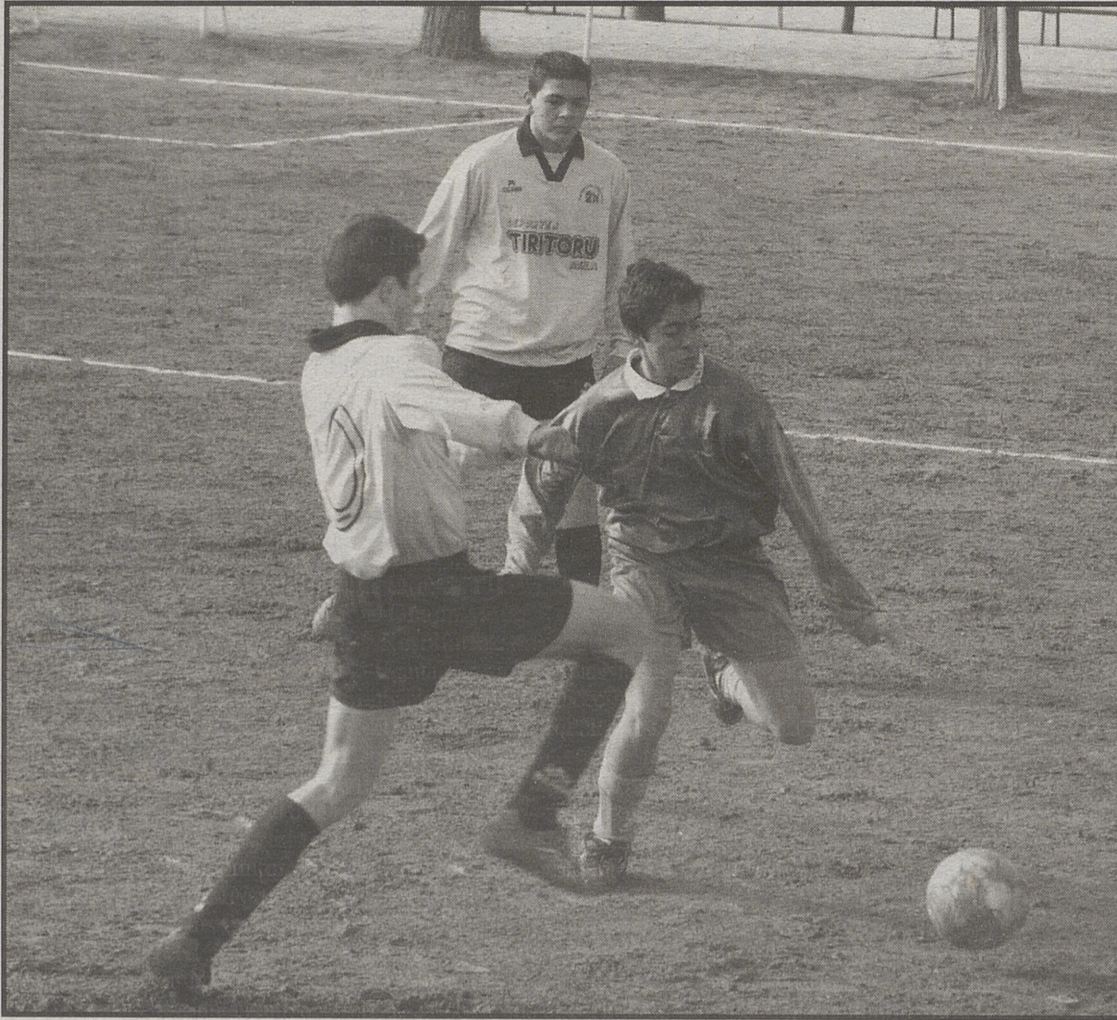
Jugadas del encuentro de la categoría cadete en el Zona Norte A y el Barco de Ávila.