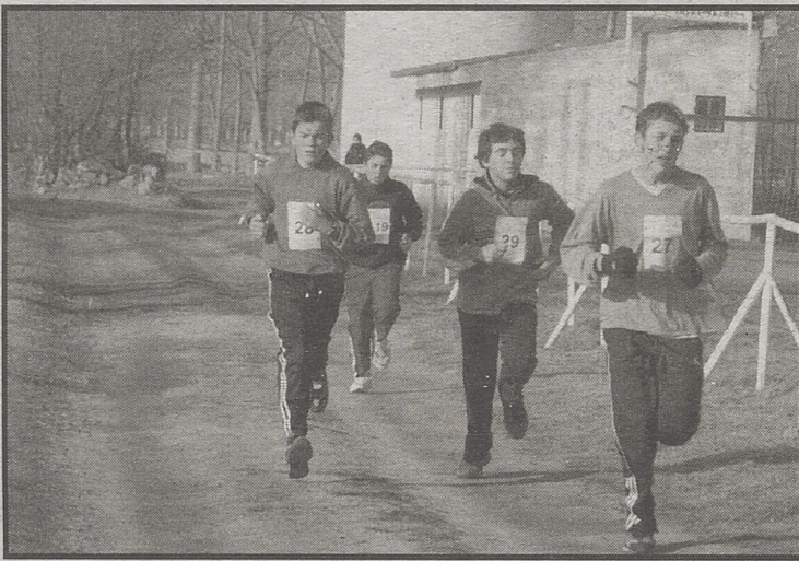
Participantes en las carreras celebradas en El Fresno el pasado sábado.