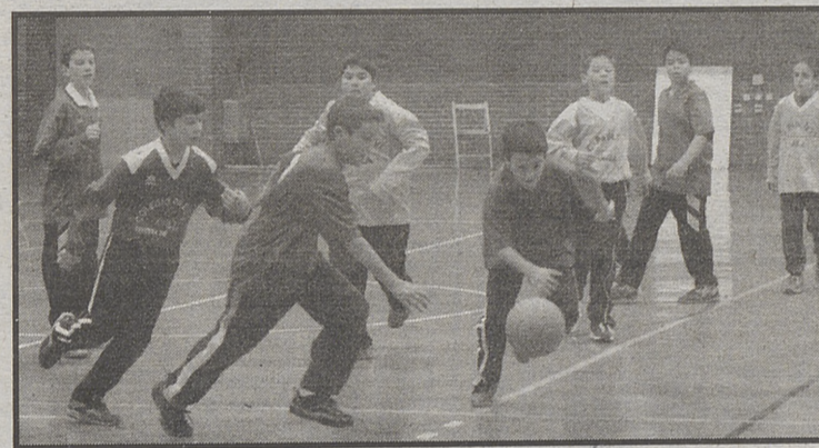
Varias jugadas de partidos de baloncesto.