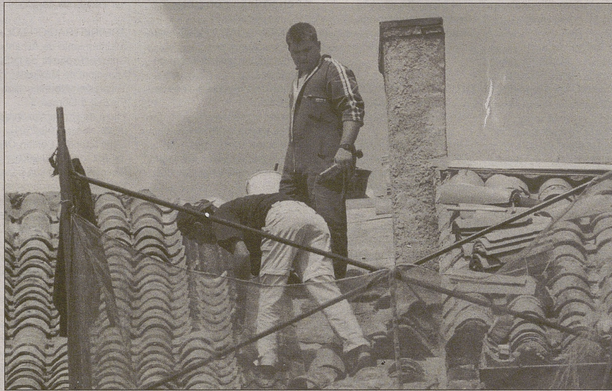
Cincuenta trabajadores perdieron la vida cuando realizaban su trabajo

En cuanto a los accidentes mortales, la causa más repetida -el 38 por ciento- fueron los atropellos o golpes con vehículos, junto con las muer-