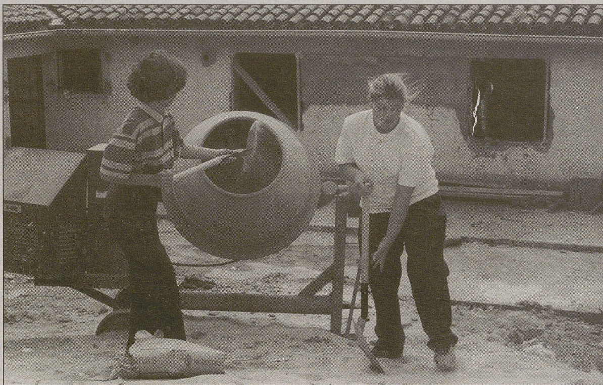
El cien por cien del empleo creado en Ávila entre marzo y junio fue femenino

Según la información recabada por el Instituto Nacional de Estadística (INE), la tasa de paro queda en el 11,9 por