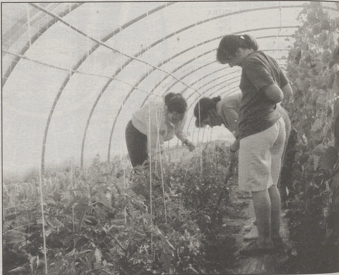
Las mujeres que trabajan en el campo ayudan con ello a sus familias y no suelen contar con protecciones sociales.

La asociación agraria UPA advirtió el pasado viernes que las últimas condiciones climatológicas que han afectado a Castilla y León podrían favorecer el brote de la enfermedad del oidio de la remolacha. Los servicios técnicos de la UPA aseguran que dadas las tormentas sufridas y las tem-