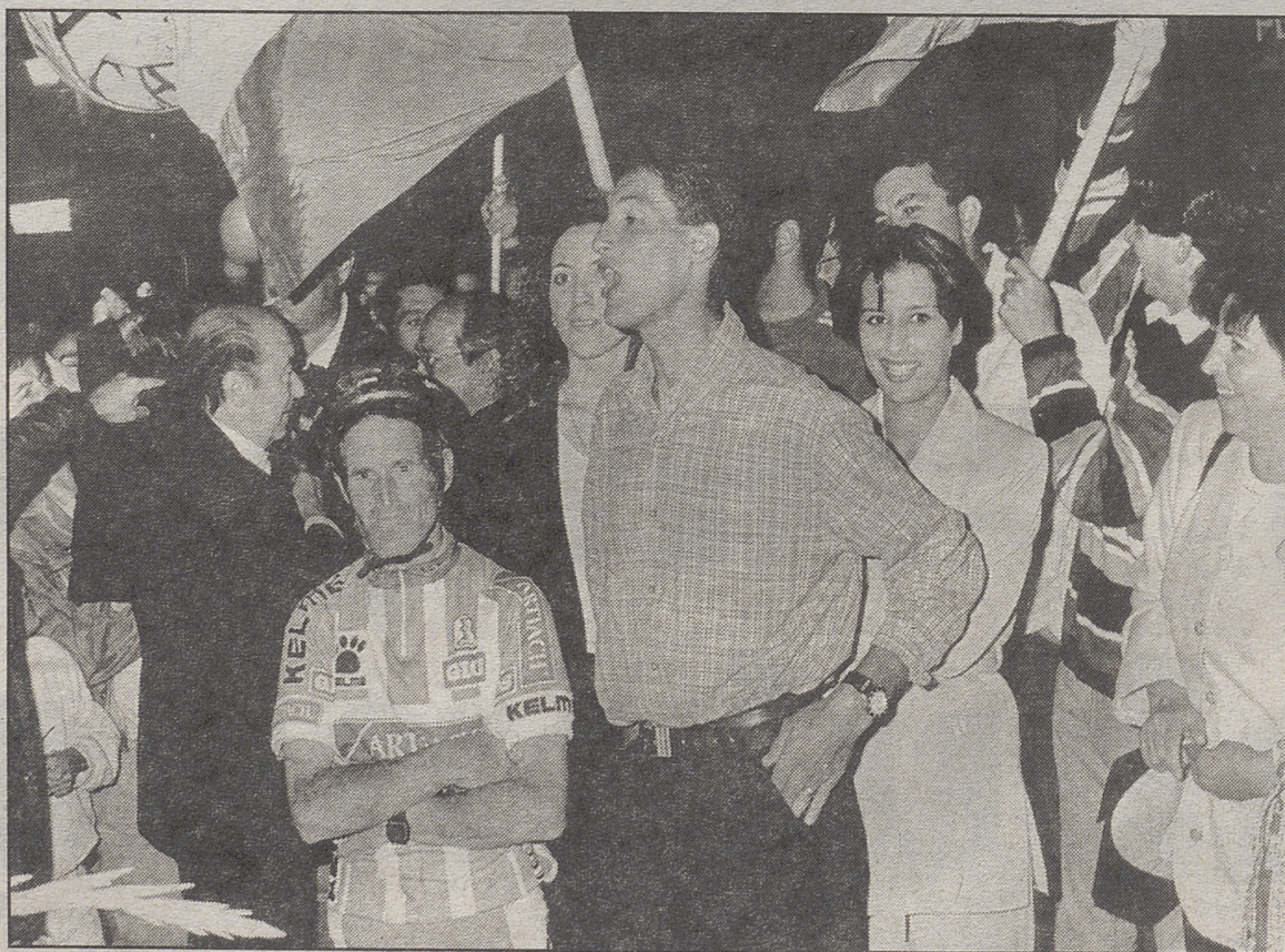
José María Jiménez, junto a los aficionados que le recibieron en El Barraco.