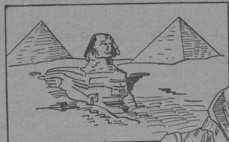
La Esfinge de Gizech, entre las Pirámides (Arriba) una de las esfinges de Tebis, unipada por los Hyksos.

Inmutable, a través de los siglos, extiende su mirada austera sobre el con-