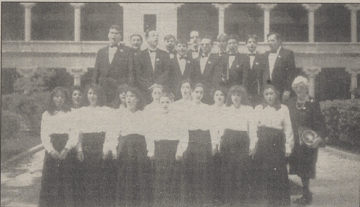
Componentes de la Coral Polifónica "San Alfonso" en el Claustro del Monasterio de Santa Ana.

Polifonía Religiosa, profana y Popular: Cantos de Tomás L. de Victoria, del Cancionero de Upsala. Finalizaron las jornadas con una conferencia sobre "Saber vivir y ser felices en la madurez", impartida por el psicopedagogo y publicista Bernabé Tierno Jiménez.