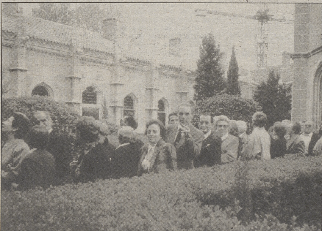
Otra de las actividades organizadas en estas Jornadas ha sido un viaje cultural.