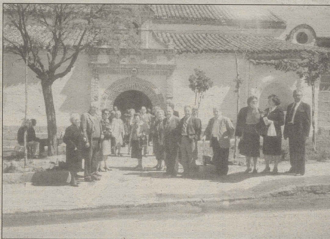
Un grupo de visitantes a la puerta de la iglesia de Santa María de la Cabeza.

(Diez años estuvo cantando y llo- rando entre rejas, no precisamente doradas. Desde el 7 de mayo de 1926 hasta el 10 de noviembre de 1935).