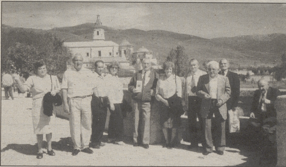
Miembros de la excursión en El Paular, delante del recinto de entrada.