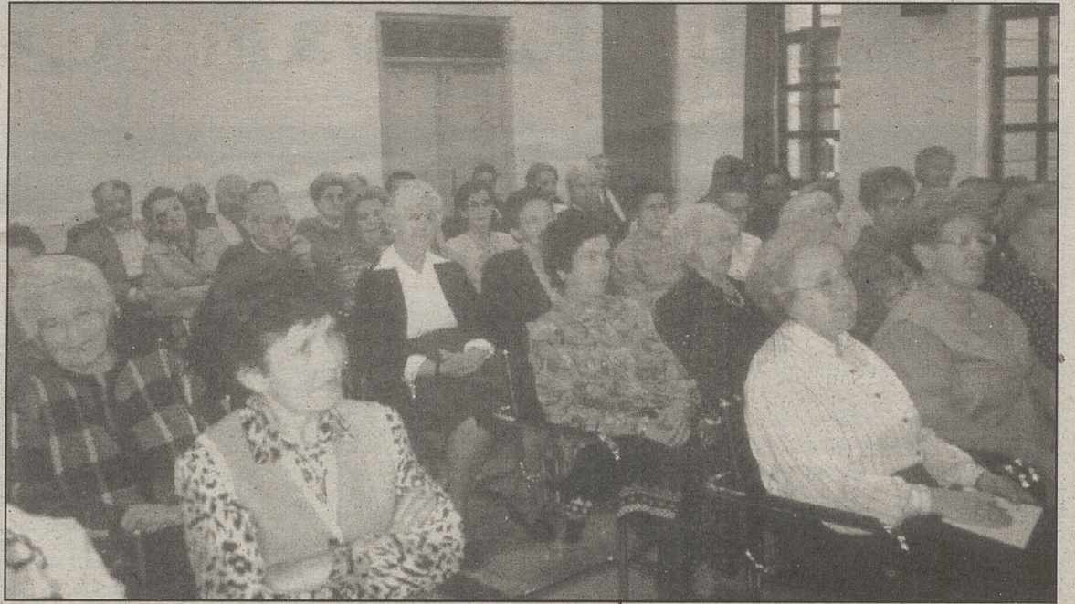
Asistentes a la tertulia "Vivir el presente".