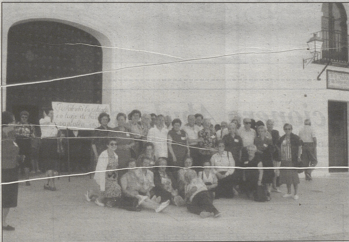
En la puerta de la ermita del Rocío, en Almonte.