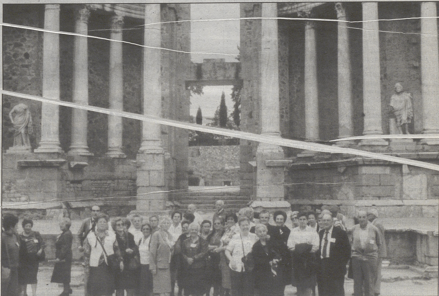
Grupo de viajeros de la Asociación de Jubilados "San José Obrero" de Ávila en el teatro de Mérida.