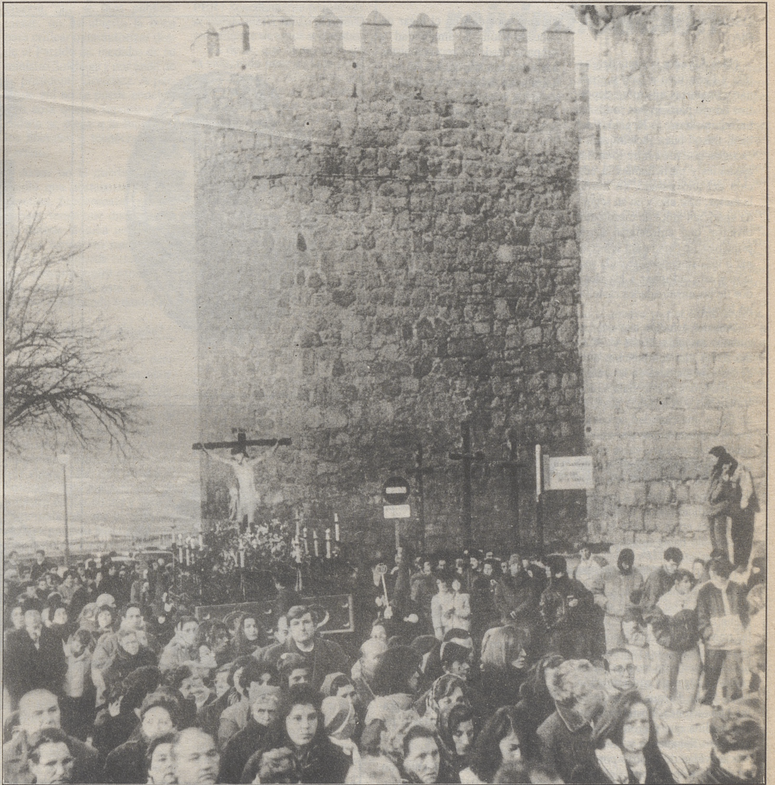
Muchos de los capuchones eran estudiantes