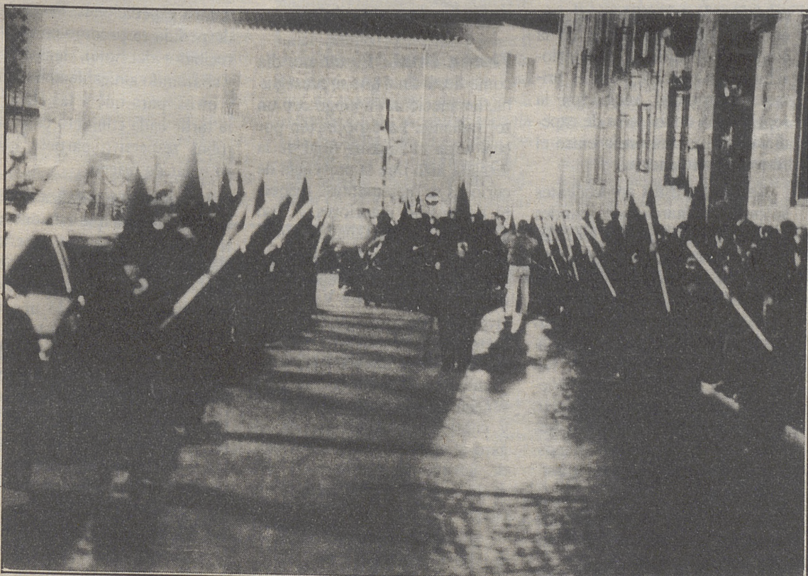
Al viacrucis acudieron más de quinientos jóvenes

Semana Santa en Ávila ha ido configurándose y adquiriendo mucho renombre, por eso está en proyecto pedir la declaración de Interés Turístico Regional para la ciudad. Con sólo haber asistido a alguno de los actos propuestos por la Iglesia y el Ayuntamiento de Ávila se podía encontrar ese sentimiento agri dulce que corría por cada uno de los abulenses.