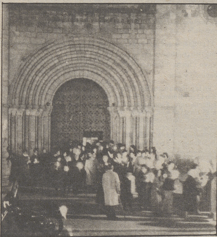
De la iglesia de San Pedro partió el Via Crucis que terminó en la ermita del Cristo de la Luz