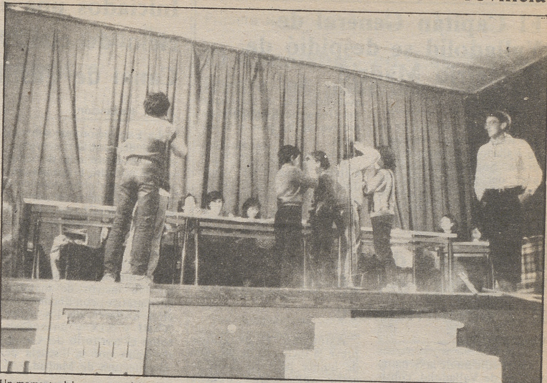
Un momento del concurso celebrado el día de la clausura de la I Semana Cultural cebrereña

Con la Hermandad de Donantes de Sangre y para tal fin han colaborado el Ayuntamiento de Madrigal de las Altas Torres y la Cruz Roja, quienes materialmente, y también moral y humanamente se volcaron en la realización y consecución de tan noble, generoso y humanitario objetivo.