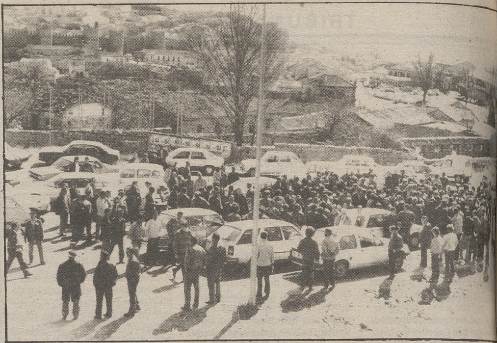
Momentos de incertidumbre. Llegaron para manifestarse y se encontraron con una prohibición inexplicable. Ante su actitud contraria a la presencia de tractores en la manifestación de...

plo", de nuestra capital, según nota del Gobierno Militar de Avila. Los ejercicios de tiro se realizarán los días 17, 18, 20 y 21, de 15,30 a 17,30 horas.