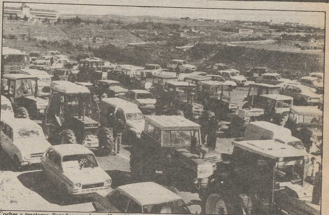
Coches y tractores, llegados para la manifestación, tuvieron cortado el tráfico junto a los Cuatro Postes LUMBRIAS

Oficialmente no se han dado a conocer los datos de los votos que se depositaron ayer aunque parece ser que la candidatura independiente de Funcionarios del Ayuntamiento consiguió un mayor número de apoyos.