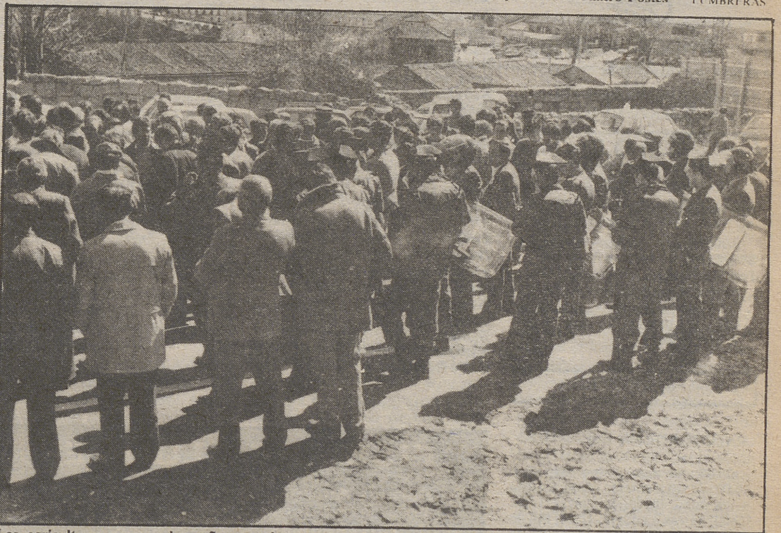
Los agricultores pasaron la mañana en la carretera. Junto a ellos, miembros de la Guardia Civil con material antidisturbios LUMBRIAS

Ayer recorrieron con vehículos varias calles de la capital