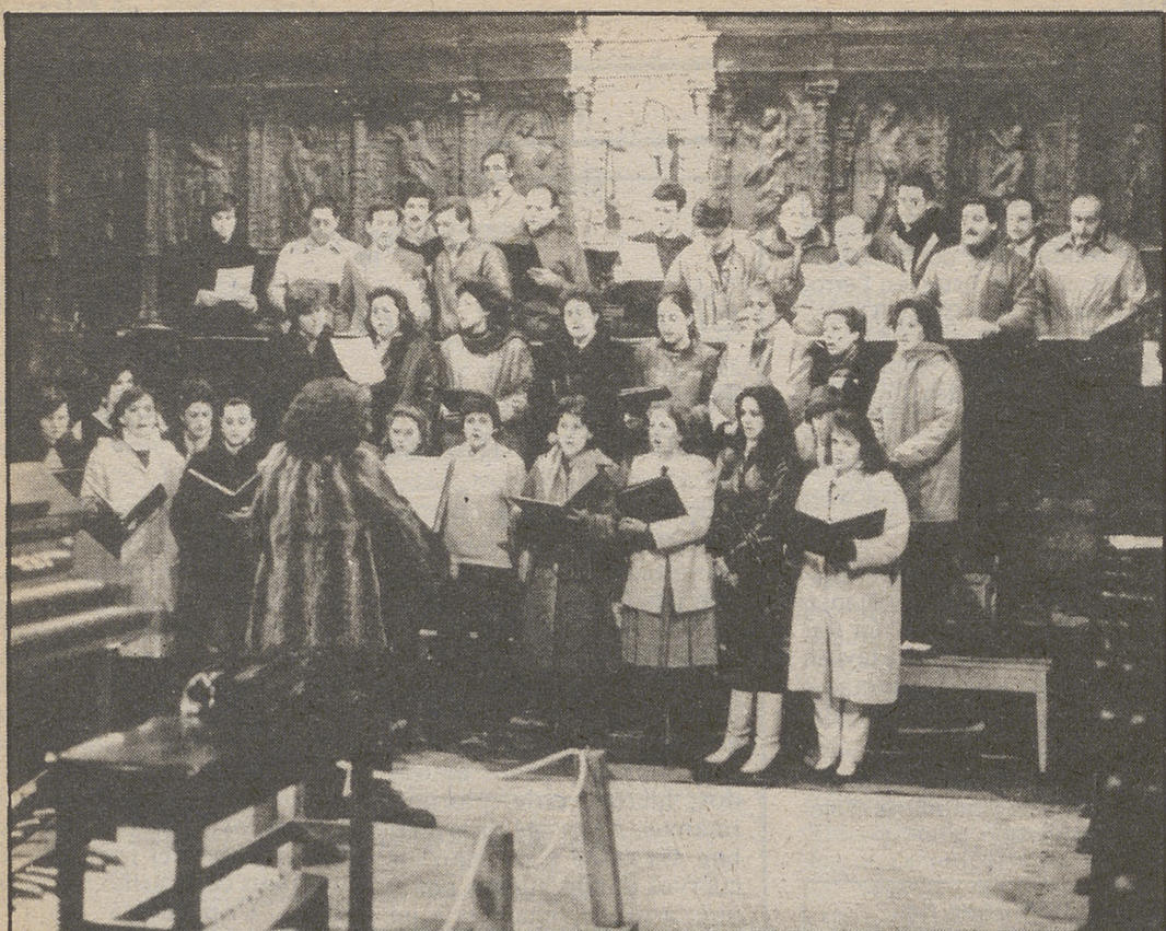
La Coral Tomás L. de Victoria en su ensayo del pasado jueves en la Catedral

Edita: Diario de Avila, S.A. Depósito Legal: AV-5-1958. Número: 27.482 Redacción, Administración y Talleres: Plaza de Santa Teresa, 12. 05001 AVILA. Teléfonos: 212640 - 212762 y 212793.