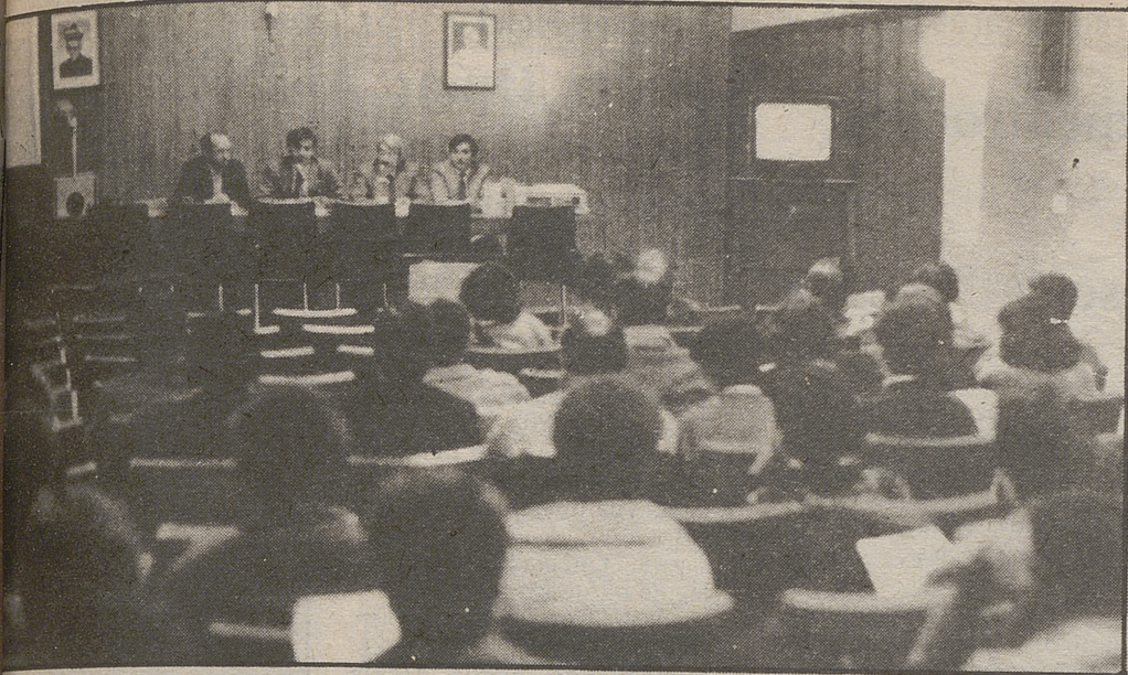
Seminario de informática para profesores en el colegio Diocesano