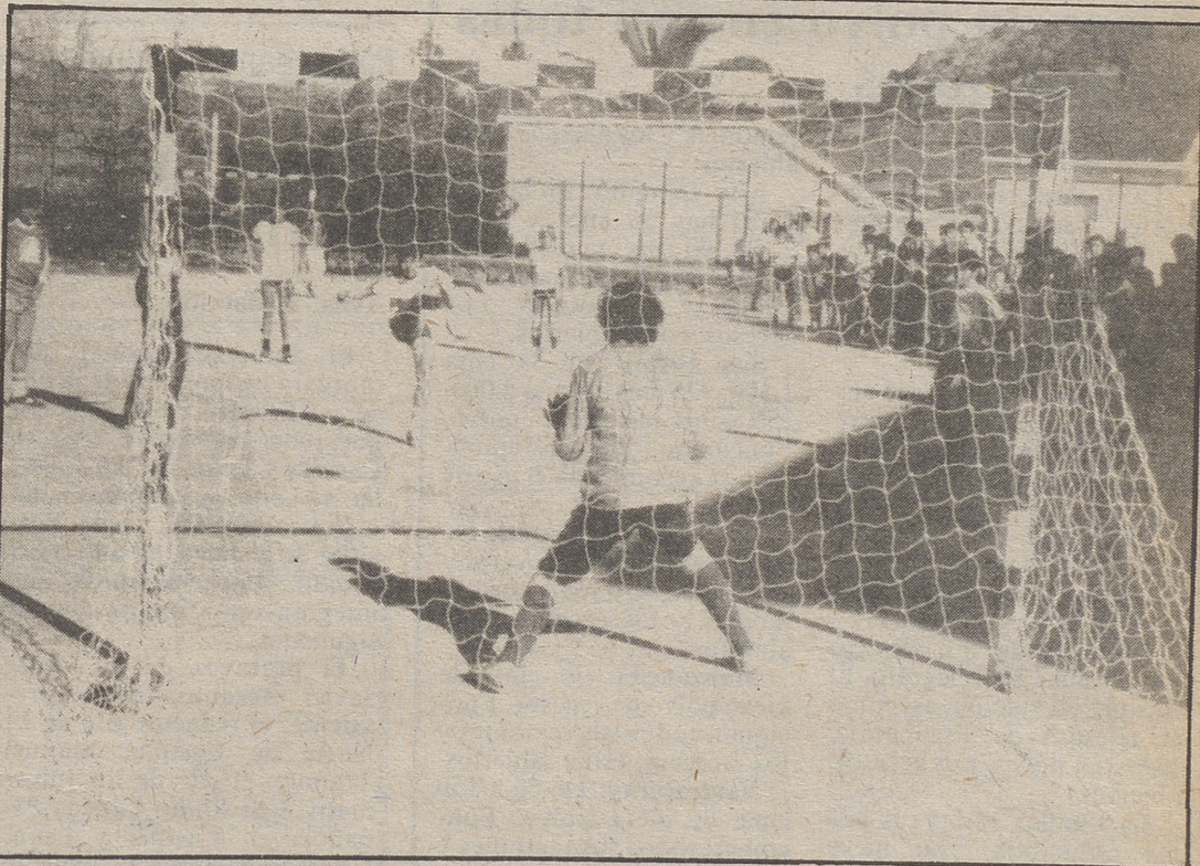
También las competiciones deportivas tuvieron su parcela en la Semana Cultural ya clausurada

el salón parroquial, tuvieron lugar los actos de clausura durante los cuales se celebró un concurso de carácter cultural que, a su vez, estaba amenizado por pruebas de habilidad, que, con un gran sentido del humor, acapalaron la atención de todos los asistentes. A continuación se efectuó la entrega de premios a los ganadores, constituidos principalmente por juguetes y libros. Finalmente, la Rondalla de Cebreros cerró estos actos con una serie de piezas musicales interpretadas con la habilidad y arte que les caracteriza y que pusieron colofón a esta I Semana Cultural Escolar.