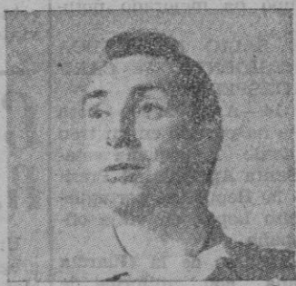
HORACE Mc MAHON

Un hombre justo que comprende los errores del delincuente