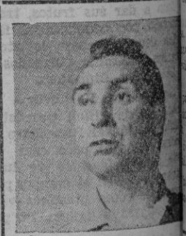
HORACE Mc MAHON Un hombre justo que comprende los errores del delincuente