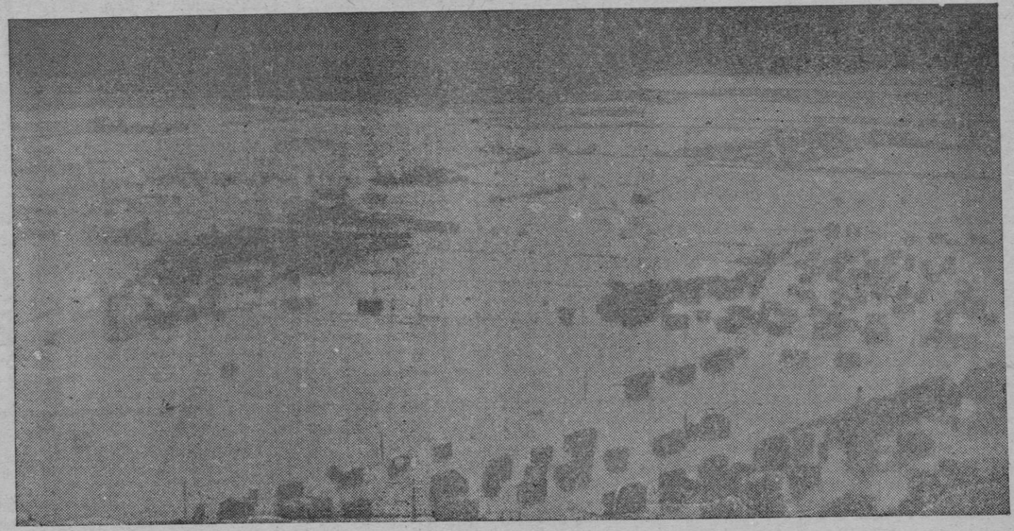
Impresionante vista general de Sutton (Inglaterra), en la que puede apreciarse la magnitud de la catástrofe producida por las inundaciones

«Podemos acoger el telegrama con reservas —ha dicho el eminente médico— pues creo que responde únicamente a un rumor sin fundamento definitivo. Lo que no es obstáculo para creer que ese momento que anuncia el telegrama —el de vencer la gripe como tantas otras enfermedades que parecían invencibles— llegará cuando culminen los estudios que se llevan a cabo incansablemente en todo el mundo para acabar con ella». Agrega el doctor Marañón que son muchos y muy intensos los estudios que se realizan especialmente en Norteamérica. Opina que el virus es todavía un fantasma al que podremos combatir de cara cuando deje de serlo. En cuanto a la epidemia de este año dice que afortunadamente parece mucho más leve que las anteriores.