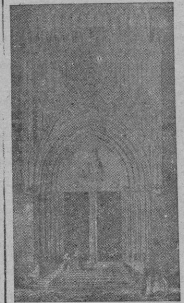
Entre otras iglesias describe Furió la del convento de Santo Domingo de esta ciudad, cuya puerta reproduce el grabado

a Mallorca, con su esposa y demás familia, para atender a la pacificación de sus naturales deteniéndose en el Isote junto a Cabrera llamado Tiquadrada por Plinio. Amílcar es blasonaba de su españolismo y en sus expediciones guerreras no podían faltar los honderos baleares, ocupando sitio de honor en las formaciones.