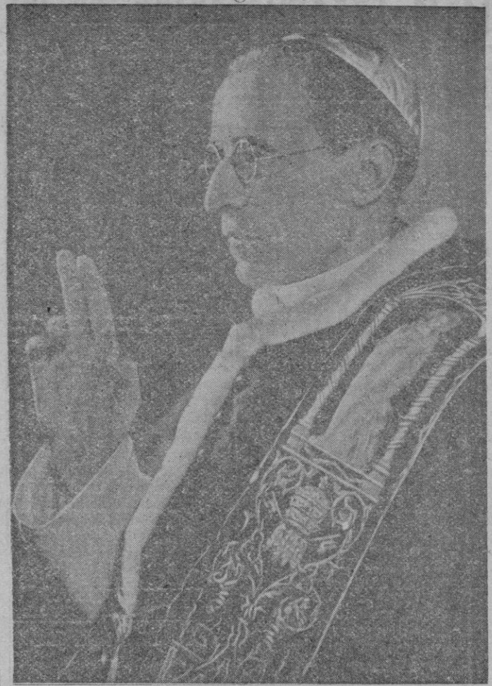
S. S. EL PAPA PIO XII QUE AYER PRESIDIO LA INAUGURACION DEL MAGNO CONSISTORIO QUE SE ESTA CELEBRANDO EN ROMA