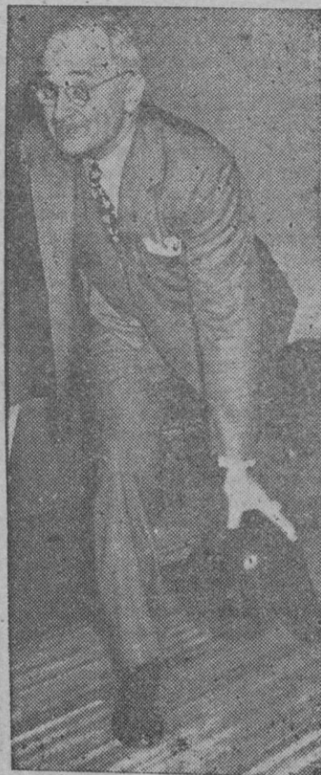
Jefe de Estado Mayor del ejército norteamericano.

Luego Truman hará un obsequio a Eisenhower, en devolución del que le hizo éste cuando era