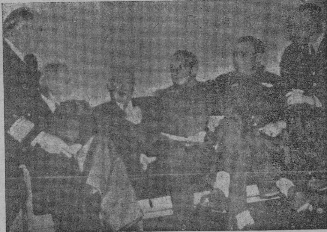
El regreso de Eisenhower de su reciente viaje a Corea ha despertado gran expectación en los Estados Unidos, donde se espera que el presidente electo haga una declaración sobre la situación de la guerra en aquella península. Durante su estancia en Seul, Eisenhower sostuvo conversaciones con altas personalidades militares, en el curso de una de las cuales fué obtenida esta fotografía transmitida por «radio»

principales importaciones que se prevén para 1953: petróleo, carbón, maquinaria eléctrica, textil y diversas herramientas, productos químicos varios (incluyendo plásticos), camiones, coches, taxis, tractores, hojas de metal y plásticos. A pesar de la disminución por ciertas exportaciones españolas, debida en parte a las restricciones dictadas por el Reino Unido y países norteamericanos, el volumen de importaciones durante 1952 alcanzará los 48 millones de dólares.