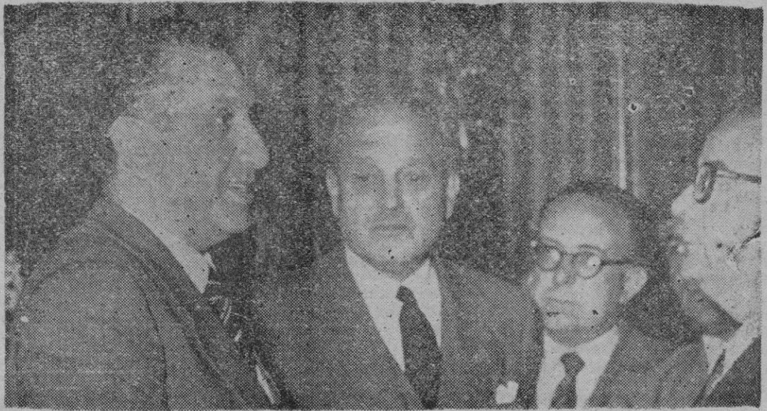
El doctor Oliveira Salazar, jefe del Gobierno lusitano, conversando con el general Ridgway, comandante en jefe de la NATO, durante su visita de este último a Portugal. La estancia del comandante en jefe de la NATO en Lisboa ha sido señalada por los comentaristas como un deseo de poner a punto la estrategia aliada en relación con la Península Ibérica.