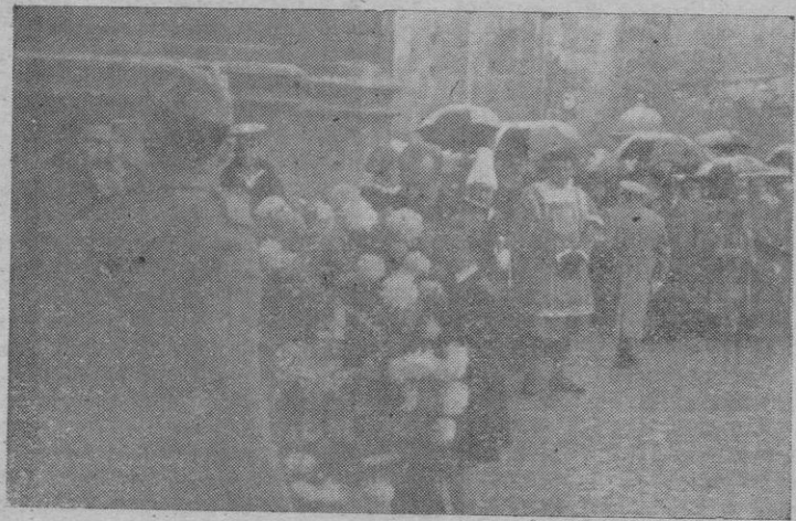
El Excmo. Sr. Gobernador Civil y Jefe Provincial del Movimiento en el acto de imposición de coronas

Continúa su interesante conferencia haciendo referencia a frases del Fundador que señalan todo el programa y lo que es y se piensa del concepto Patria resaltando la gran lealtad de José Antonio hacia todos los su-