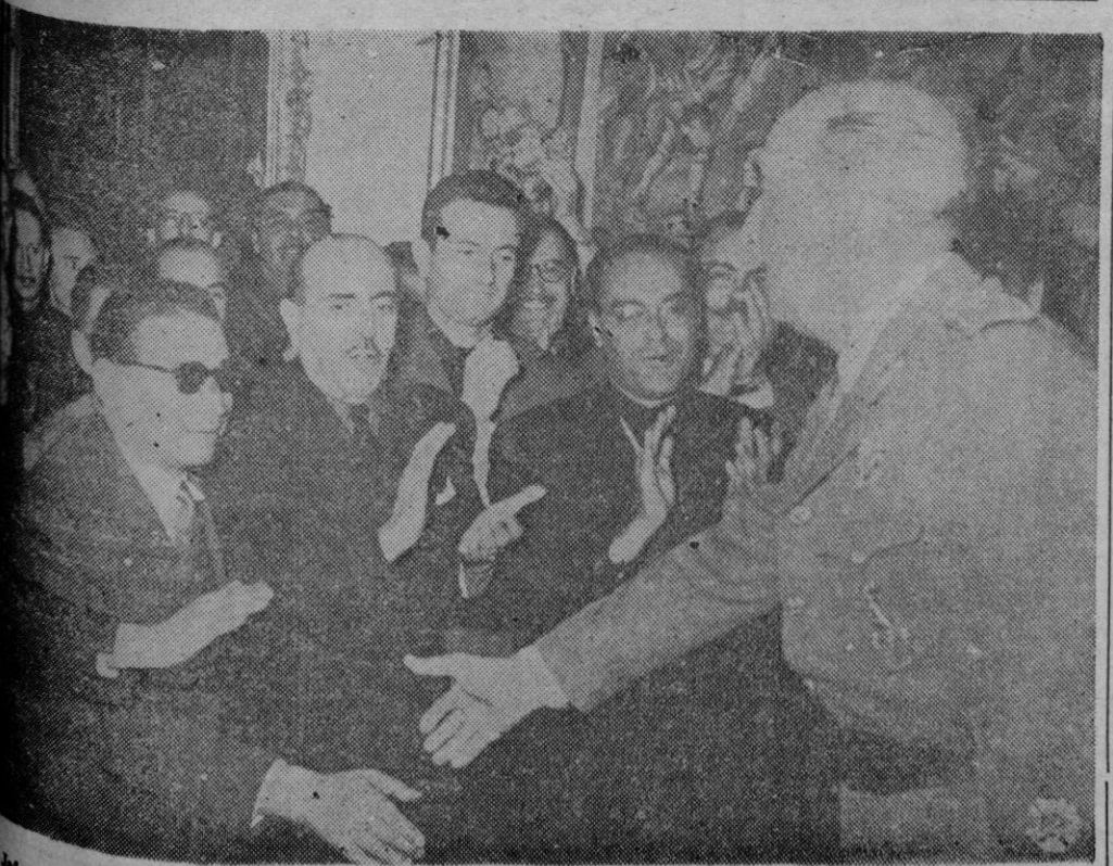
El Sr. Franco recibió en El Pardo a los miembros del I Consejo Político Sindical, cuyas conclusiones expuso el delegado nacional de Sindicatos. En la fotografía Franco saluda a los consejeros correspondiendo a sus aclamaciones.