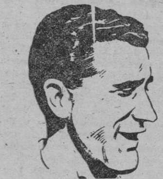
IPIÑA, el entrenador del Real Madrid, que juega el domingo un trascendental partido con su gran rival regional