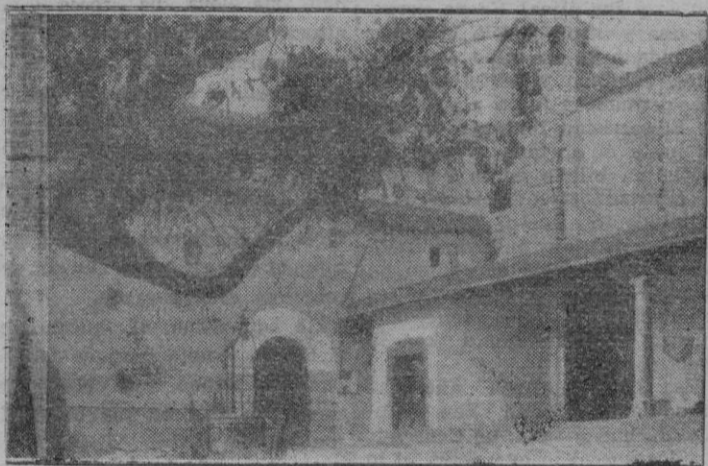
Convento de San Jerónimo

mucho, muchísimo. Padría escribirse un gran volumen con lo que llegó hasta mí. Oí mucho bueno y mucho malo.