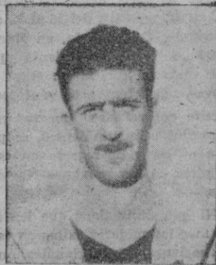
CANELLAS, la nueva adquisición del Constancia

La tabla clasificatoria del Campeonato Regional pregona que la recuperación del Constancia es una realidad. Sus triunfos fuera de casa, conseguido en los terrenos de equipos