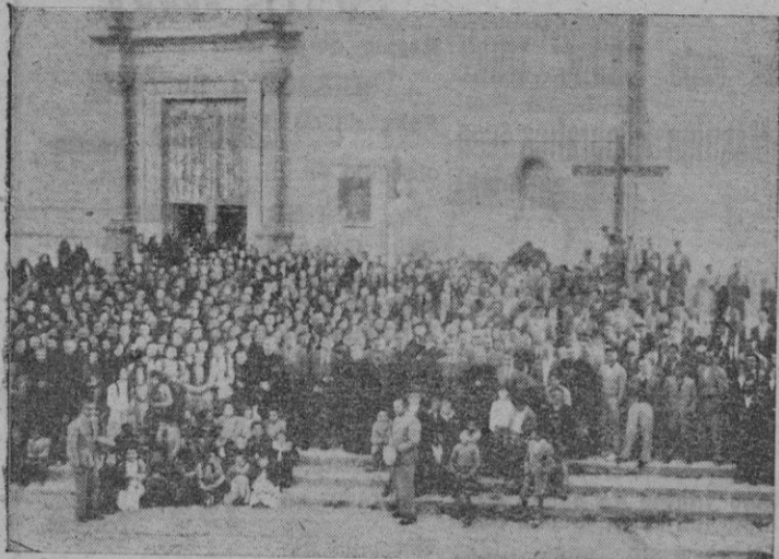
Un numeroso grupo de asistentes a uno de los actos de la Semana Parroquial de Porreras.