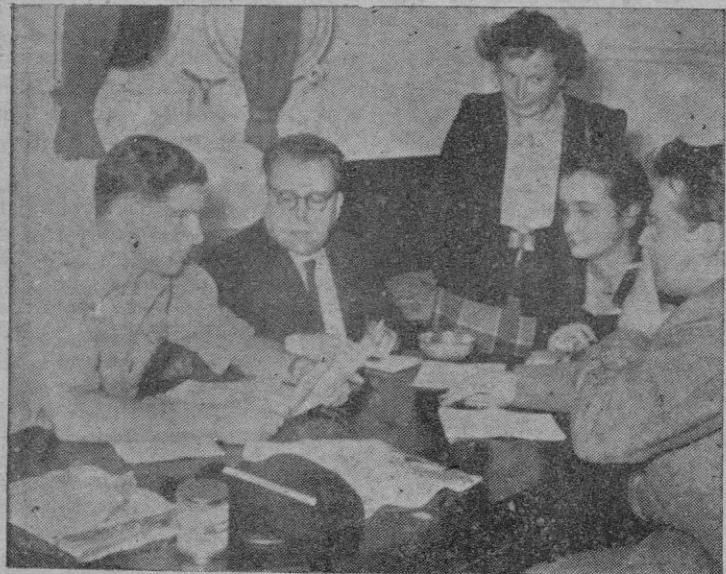
Uno de los jefes del crucero «Devonshire» conversando con los informadores en una de las cámaras del navío.