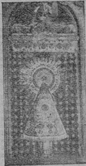
Lo Virgen del Pilar

Los españoles, si bien cometieron, como todo pueblo, errores, también supieron comprender como nadie, y a su debido tiempo, el momento de la mayoría de edad de las naciones, dándoles su libertad; pero esta misma libertad que no es signo de grandeza cuando se vive aislado, sino que se perfecciona en la vida en comunidad, en íntima unión de ideales; es la tendencia de la nueva España: aunar los espíritus de las naciones que llevan nuestra sangre, formar junto a la Cruz y auparse por encima de los materialismos actuales para proclamar la grandeza de la Hispanidad, ocupan-