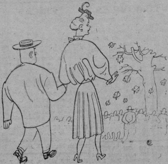
—No creo que nadie se atreva a sospechar que vestimos a la medida.