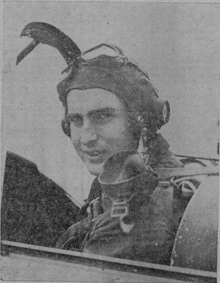
El príncipe Nicolás de Yugoslavia que efectúa en la escuela de Fairoaks, Chobham, de la R.A.F. inglesa, un período de aprendizaje de quince días de duración. El príncipe tiene 24 años de edad y durante su aprendizaje cobra la cantidad de 12 chelines diarios.