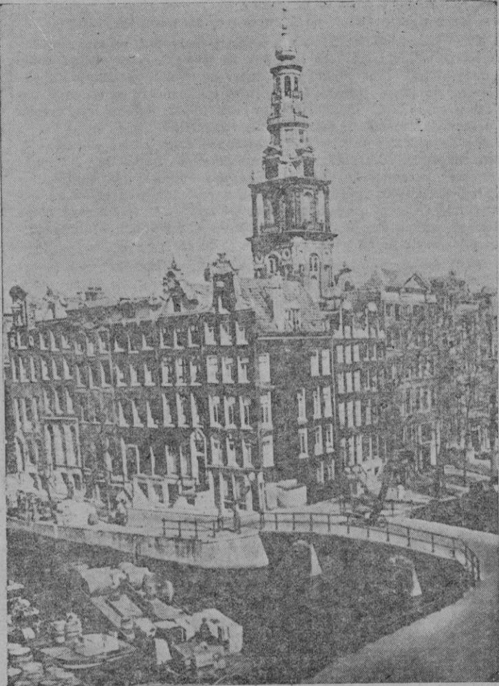
Un aspecto de Amsterdam, llamada la Venecia del Norte

ron las primeras elecciones con el sistema de representación proporcional, los católicos han sido siempre los más numerosos de los Estados generales, y no han fal-