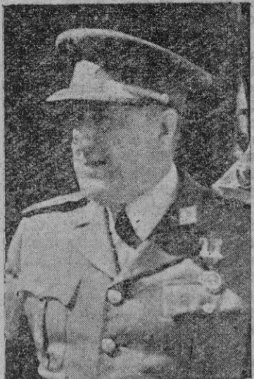
El Excmo. Sr. Capitán General de Baleares

coroneles, jefes de cuerpo y la totalidad de oficiales francos de servicio del Cuerpo.