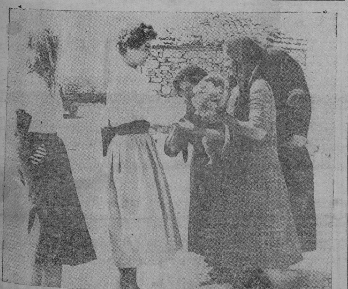
S. M. la reina Federica de Grecia, acompañada de la princesa Sofia, visitó la región de la Tracia. En la fotografía, dos campesinas rinden homenaje a la soberana y su hija. En esta comarca se halla enclavada la isla de Gamma, recientemente disputada entre Grecia y Yugoslavia.