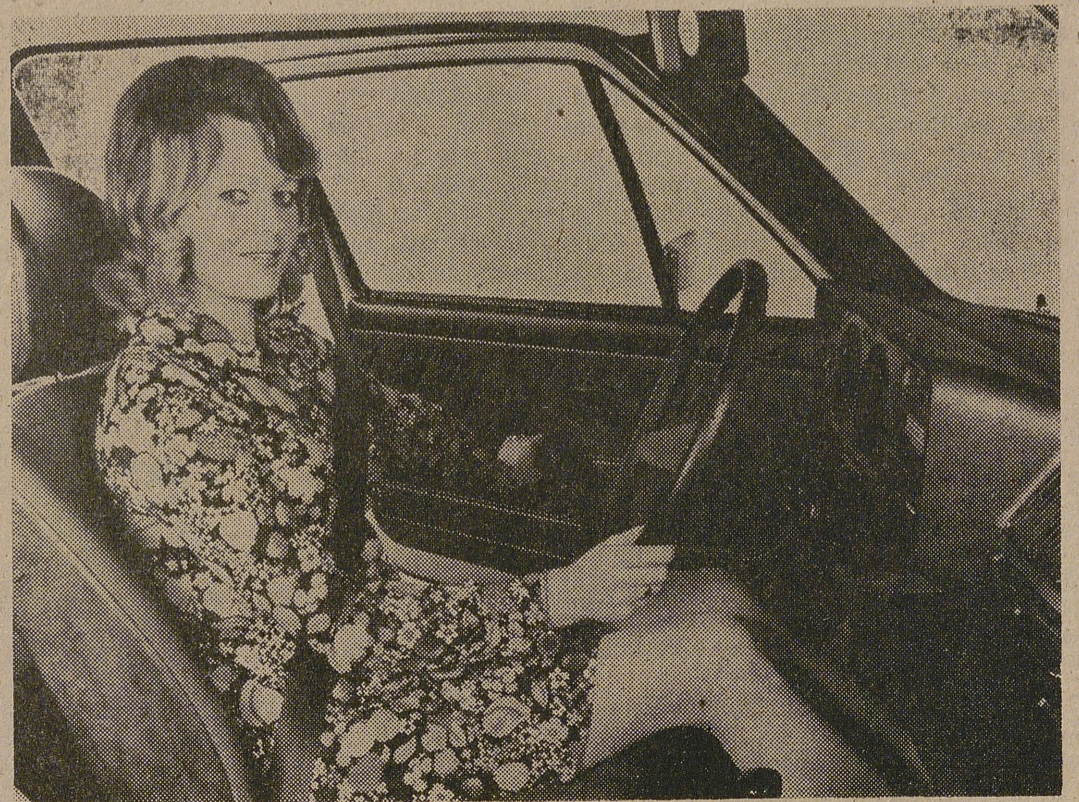
BONN. (DaD). — La fábrica de automóviles Volkswagen acaba de lanzar al mercado un nuevo cinturón de seguridad de tres puntos de sustentación y que se abrocha automáticamente al cerrar la puerta del vehículo (fotografía). El cinturón de seguridad será obligatorio en la República Federal de Alemania a partir de enero de mil novecientos setenta y seis, ya que ha quedado absolutamente demostrado que el cincuenta por ciento de las personas muertas en accidentes de carretera habrían sobrevivido el accidente de haber llevado cinturón de seguridad.