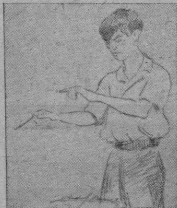
Dibujo de D. Pedro Barceló

Brillantísimo resultó el primer tiempo y en el famoso "allegretto" consiguió una interpretación pocas veces igualada tanto por los efectos como por la emoción que supo imprimir a todo el tiempo.