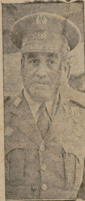
El teniente general señor García Valiño

Un periodista, con relación a la política de inteligencia hispano árabe solicitó la opinión personal del alto comisario sobre el papel a desempeñar por Marruecos ante lo que el Teniente General García Valiño contestó: