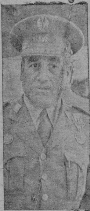
El teniente general señor García Valiño

Tetuán, 30 (Cifra). — El alto Comisario Teniente General García Valiño, a petición de los periodistas, corresponsales de la prensa marroquí, árabe y extranjera, que acudieron a cumplimentarle con motivo de celebrarse el primer aniversario de su mandato al frente de la Alta Comisaría, les recibió en la residencia y sostuvo con ellos una amplia conferencia.