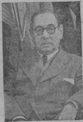
EL MAESTRO DIAZ GILES

El maestro Díaz Giles es personaje grande en la zarzuela española. "El cantar del arriero", "El renegado", "La ventera de Medina" — no queremos alargar la lista — son obras demasiado conocidas para que sea necesario adjetivar a su autor.