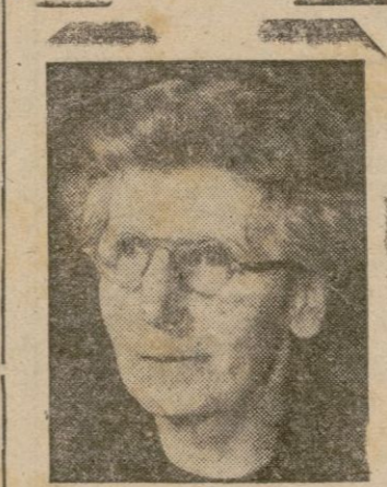
Miss Florence Horsburgh, Ministre de Educación del gobierno británico. Es la primera mujer que llega a tan alto cargo con los "torres". Hace veinte años fué elegida por primera vez para ocupar un puesto en la Cámara de los Comunes.

Edgar Faure llegó al Palacio del Eliseo poco después de las tres de la madrugada, para hacer entrega de su dimisión al presidente Auriol quien ha aceptado la dimisión del primer Ministro Edgar Faure y su gobierno, cons tituido hace cinco semanas.