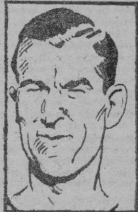
SIIRRA, el entrenador del equipo del REAL MURCIA

También acordó el Comité adoptar públicamente que se dispusiera a adoptar las más severas sanciones reglamentarias, para corregir los excesos de los públicos, que se extralimitan en su natural pasión, cometiendo actos contrarios a la deportividad con que deben presentarse los partidos.