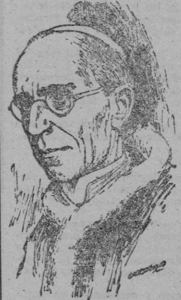
car de numerosas regiones de la tierra todo lo que es divino y cristiano". El Papa termina diciendo: "A (Continúa en la pag. 6)

CIUDAD DEL VATICANO, 12 (Efe). — En la encíclica "Sempiternus rex", el Padre Santo trata en primer lugar de los aspectos históricos del Concilio y condena ciertos errores modernos contra la cristología. La doctrina del monofisismo era sostenida por la escuela de los que creían que sólo había una naturaleza en Jesús, que su humanidad estaba enteramente absorbida en su divinidad y que su cuerpo no era de la misma sustancia que el del hombre. En su encíclica, Pío XII dirige un llamamiento para que vuelvan al seno de la Iglesia Romana quienes hace quince siglos se separaron de ella, insistiendo en las razones que obligan a la unidad entre los cristianos. El Santo Padre añade: "Existe además otro motivo que reclama insistentemente que, bajo el único signo del nombre cristiano, se cierren las filas a la mayor brevedad posible para combatir los violentos asaltos del enemigo infernal, enemigo que, lleno de odio y de crueldad, amenaza con arran-