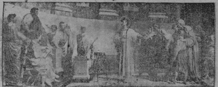
La festividad de San Lorenzo tiene en la liturgia un relieve especial, de acuerdo con la categoría del Mártir, archidivino de la Iglesia romana. El cuadro arriba ofrecido — de Francesini — recuerda el gesto del Santo al juez que le exige la entrega de los bienes eclesiásticos de que era administrador. Y Lorenzo presenta a las acordes de un unítrane a los pobres — «entestando» — «He ahí mis tesoros».

REDACCION, ADMINISTRACION Y TALLERES: MORA, 3 — Telefonos: 1973 — 2853. PRECIO DEL EJEMPLAR 70 CS. — SUSCRIPCION MENSUAL: 15 PTAS.