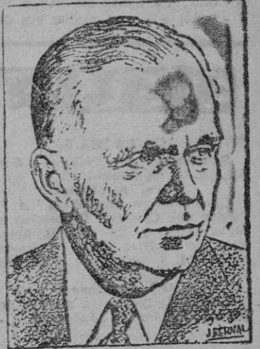
EL GENERAL MARSHALL

Agregó que es católico practicante desde hace seis años y que conserva un maravilloso recuerdo de la audiencia que le concedió el Papa Pío XII.