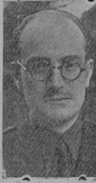
El Ministro de Educación Nacional cubierto esta mañana solemnemente la lápida que la Asociación de la Prensa de Madrid ha colocado en la caa núm. 28 de