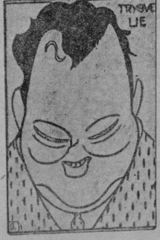
TRYGVE LIE fuerzas de las Naciones Unidas están construyendo fortificaciones permanentes a lo largo del paralelo 38 y se replegarán hacia ellas inmediatamente si se concerta un armisticio, según ha revelado una alta autoridad británica.

primeras revelaciones de la entrevista Eutezan - Malik. Fortificaciones a lo largo del paralelo 38 LONDRES, 26 (Efe). -- Las