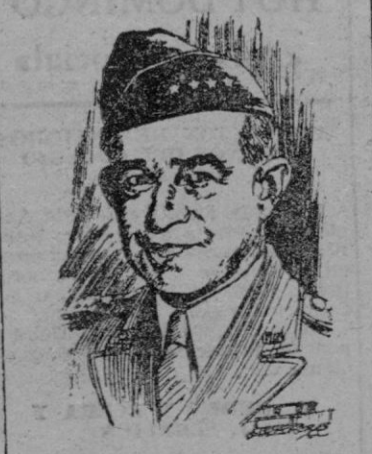
EL GENERAL BRADLEY

Debemos admitir señaló Bradley que Rusia dispone de la bomba atómica y puede utilizarla.