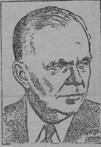
EL GENERAL MARSHALL

WASHINGTON, 8. (Efe). — La política de los Estados Unidos en Corea es — dijo el general Marshall ante las comisiones senatoriales de relaciones exteriores y fuerzas armadas — inlingir tan terribles bajas a los