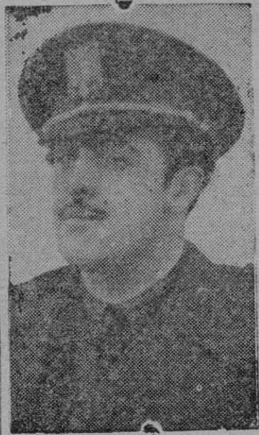
EL MINISTRO DE TRABAJO

ma económico enriquecido en que se debate el mundo, ha neutralizado en cierto modo el valor de las posiciones alcanzadas. Práctica de estos principios con su original y personalísima idea de los institutos de enseñanza media laboral, de los que partirán, como exploradores, los primeros grupos laborales en la marcha