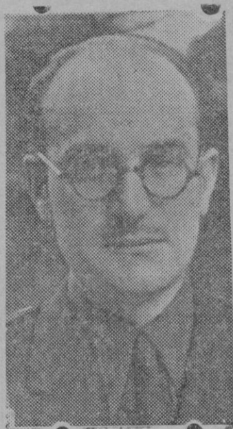
El Ministro de Educación Nacional