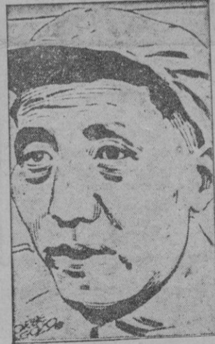
Mao — Tse — Tung

¿Quién ha matado a Goering? Parece ser que por fin la incógnita se ha despejado: ahora ha matado a Goering — el mariscal del III Reich — aquel que le suministró el veneno para suicidarse;