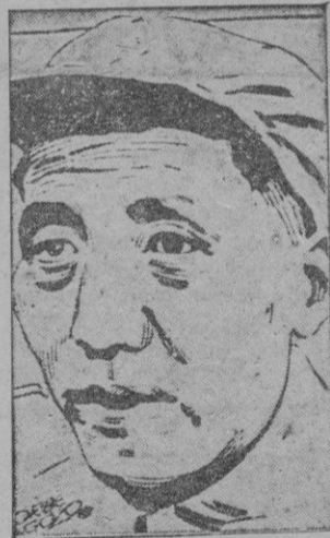
Mao — Tse — Tung

¿Quién ha matado a Goering? Parece ser que por fin la incógnita se ha despejado: ahora ha matado a Goering — el mariscal del III Reich — aquel que le suministró el veneno para suicidarse;