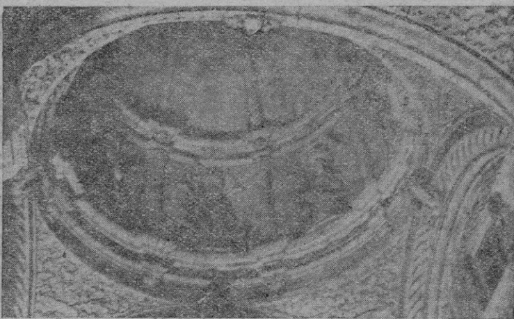
Vista parcial de la cúpula

AÑOS más tarde, Domingo, fundaba una Orden apostólica cuyos miembros, monjes y apóstoles a la vez, se encargaron de propagar por el orbe la devoción del Rosario. Y en memorable ocasión nos la trajeron a Mallorca cuando, en compañía de los soldados del Rey Conquistador, vinieron también ellos a conquistarla para Cristo. Porque a "ellos cupo principalmente la misión gloriosa de redimir y conquistarla espiritualmente a la fe católica. Por eso en los puntos más estratégicos de la isla fueron edificando, con paciencia de siglos, aquellos magníficos conventos que fueron desde un principio conaques de apóstoles infatigables y escuelas de santidad y sabiduría... Ellos, los frailes predicadores, con su cultura, su elocuencia y su pie-