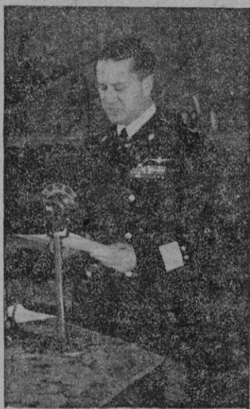
El Conde Ciano, cuyo diario cita repetidas veces el autor en esta biografía

Luego me contó otras cosas y entre ellas algo que yo no hubiera podido imaginar siquiera. Según órdenes dictadas por el propio Hitler, un general alemán podía mandar las tropas de las S.S. en el campo de batalla y durante las operaciones, pero luego no tenía derecho a someterlas a su disciplina.