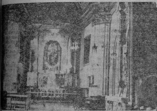
La capilla del Rosario del Convento de Manacor

En el fondo, y bajo una bóveda de cañon igual a la de entrada, está el altar mayor de la capilla que es, a la vez, el altar del Santísimo y a cuyos lados están las puertas que conducen al camarín donde, en lugar preeminente, está colocada la Virgen del Rosario con el Niño. Es imagen de talla de notable valor artístico y de mucha devoción. Debajo el altar hay un hermoso sarcófago destinado a guardar las reliquias del insigne mártir San Teófilo que el padre Pío Caldentey, dominico exclaustro, octu-