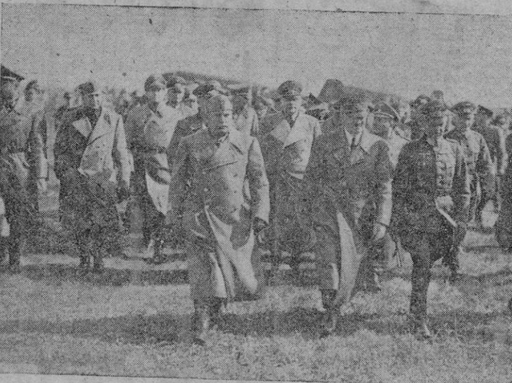
El Führer y el Duce al frente oriental durante la guerra. Hitler y Mussolini van acompañados del Estado Mayor alemán.

las empleadas por Himmler, Goering y otros varios. El 29 de Abril, el radio del bunker capta la BBC de Londres y por ella se entera Hitler que Himmler negocia la capitulación con los aliados; esto tiene por consecuencia que el general Fegelin, uno de los que están en el bunker de la Cancillería, sea