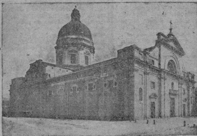
Aspecto general de la hermosa Basílica de Asís, que guarda en su interior la primitiva iglesia franciscana de la Porciúncula, cuyo Jubileo comienza hoy

También se dice que la Comisión se dispone a probar sus más modernas armas atómicas en el atolón de Eniwetok, en el Pacífico, probablemente en la primavera próxima. Igualmente se comunica que se está estudiando el tratamiento del cáncer con varios substitutivos del radium.