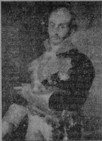
El tercer Marqués de la Romana

PERO, ¡qué despertar más admirable!, exclama Menéndez y Pelayo. ¡Dicho asunto en que ningún encarecimiento puede parecer retórico! ¡Bendecidos muros de