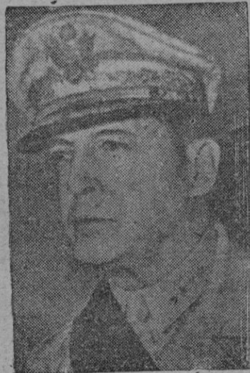
EL GENERAL MAC ARTHUR

Tokio, 6 (Efe). — El General Mac Arthur jefe supremo aliado en el Japón ha ordenado al gobierno japonés que declare fuera de la ley a la comisión central en pleno del partido co-